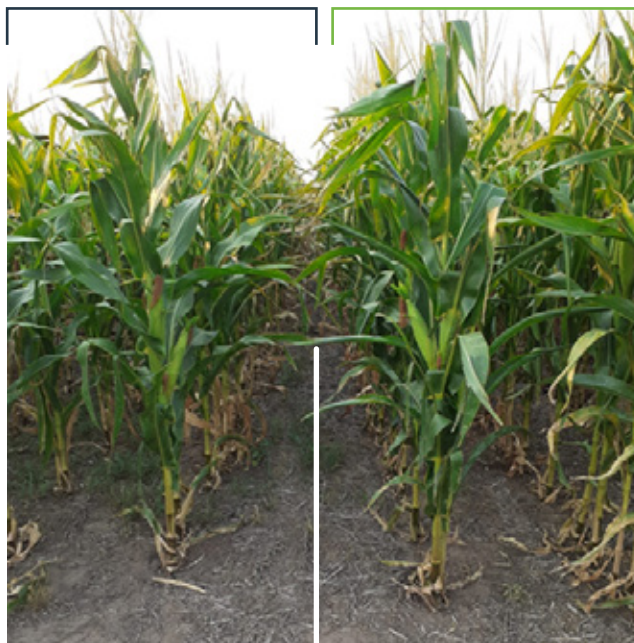
Ensayos en cultivo de maíz, Pergamino, Buenos Aires, Argentina, campaña 2021/22.

TRATADO CON FERTILIZANTE NITROGENADO MAS LYRA